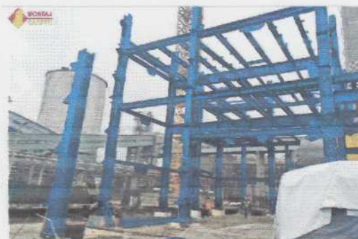
Constructie metalica Combinat Azomures