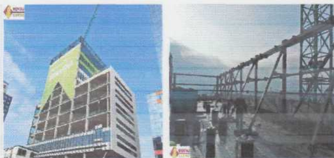
Executie si montaj structuri metalice Skanska Green Court Bucuresti – detalii