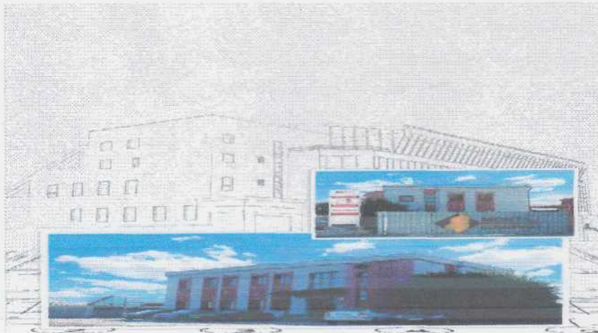
Sediu Social Montaj Carpati Puchenii Mari, Ploiesti

Imagini ale activitatilor societatii si lucrari executate care ne reprezinta calitatea si implicarea in probleme de ecologie.